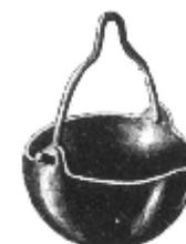
1101 mit Einhängebügel