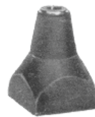
2 u. 2a