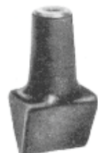
Typ 9 u. 10