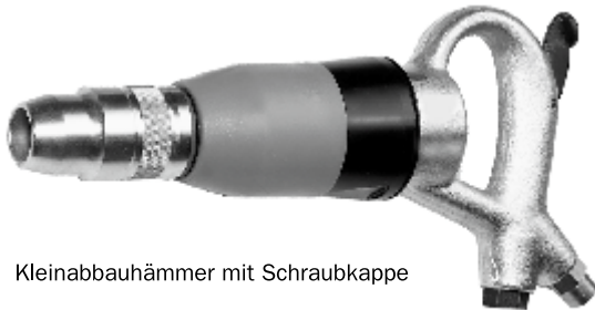
Kleinabbauhämmer mit Schraubkappe

Variacor-Drehgelenk für alle Druckluftwerkzeuge siehe Art. 190B