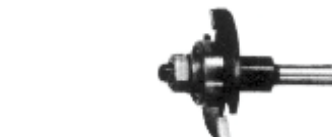
Scheibennutfräser montiert auf Spindel

Alle Fräswerkzeuge mit Schaftdurchmesser ab 12 mm und Werkzeuge mit Schneidendurchmesser über 16 mm nur mit gespanntem Werkstück verwenden.